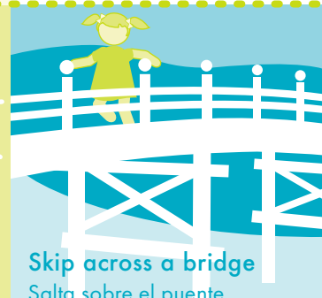
Skip across a bridge Salta sobre el puente