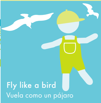
Fly like a bird Vuela como un pájaro