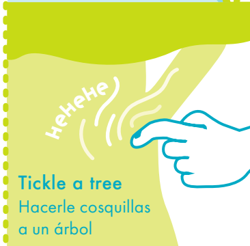
Tickle a tree Hacerle cosquillas a un árbol