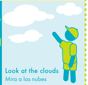
Look at the clouds Mira a las nubes