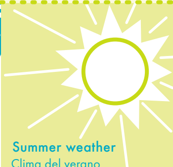
Summer weather Clima del verano