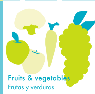
Fruits & vegetables Frutas y verduras