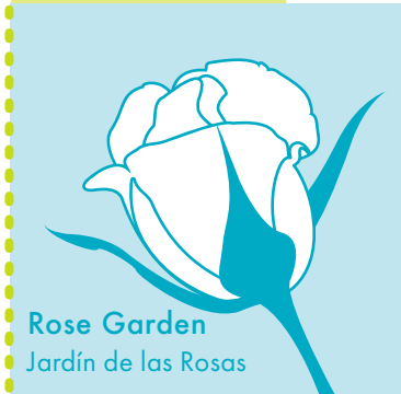
Rose Garden Jardín de las Rosas