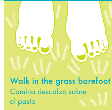
Walk in the grass barefoot Camina descalzo sobre el pasto